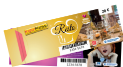
ENSEIGNES CULTURELLES + RESTAURANTS offre réservée aux particuliers